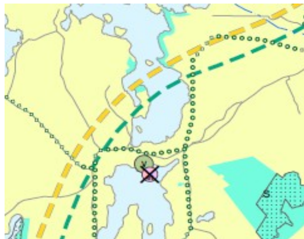
Bild: Utdrag ur den anhängiga etapplandskapsplanen (1/2021) © Kimitoöns kommun

Området hör till ett målområde för utveckling av turism, friluftsliv och rekreation.