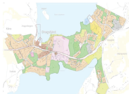
Bild: Utdrag ur gällande detaljplan för Kyrkobyn (1/2021)

I området gäller Kyrkoby detaljplan (vunnit laga kraft 21.2.1995). I planen har det på planeringsområdet anvisats kvarter för fristående småhus (AO), parkområden som ska bevaras i naturtillstånd (VP), gatuområden enligt planen och kvarter för allmänna byggnader (Y). Genom området har det märkts ut en körförbindelse i öst-västlig riktning.