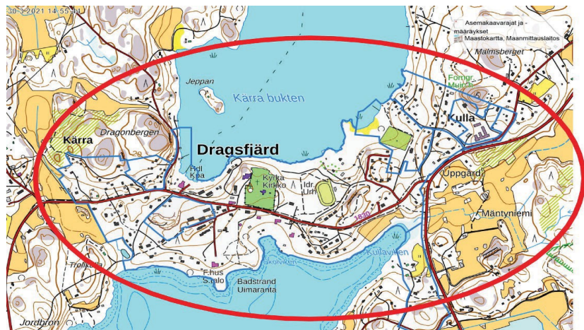
Bild: planeringsområdets läge på en guidekarta.

Syftet med detaljplaneändringen är att undersöka olika lösningar för att uppdatera och modernisera detaljplanen för Kyrkobyn.